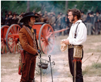
2004 ALAMO (The Alamo) de John Lee Hancock avec Jordi Moll