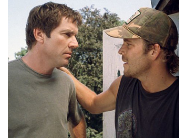
2003 LA GORGE DU DIABLE (Cold Creek Manor) de Mike Figgis avec Stephen Dorff