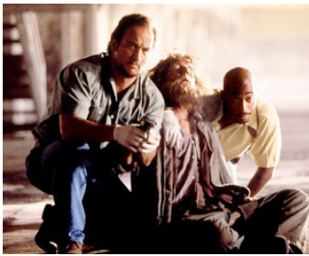
1997 FLICS SANS SCRUPULES (Gang Related) de Jim Kouf avec James Belushi, Tupac Shakur