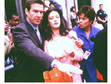
2000 TRAFFIC (Traffic) de Steven Soderbergh avec Catherine Zeta-Jones