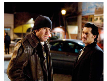
2008 LES CAVALIERS DE L'APOCALYPSE (Horsemen) de Jonas Åkerlund avec Clifton Collins Jr