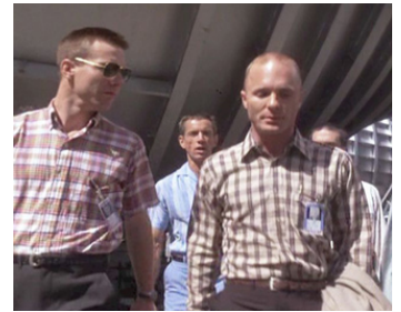
1983 L'ÉTOFFE DES HÉROS (The Right Stuff) de Philip Kaufman avec John Glenn, Ed Harris