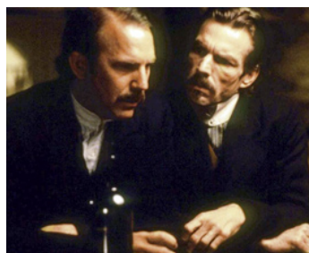
1994 WYATT EARP (Wyatt Earp) de Lawrence Kasdan avec Kevin Costner