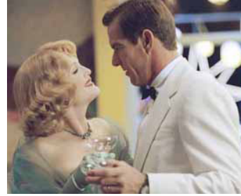
2002 LOIN DU PARADIS (Far from Heaven) de Todd Haynes avec Julianne Moore