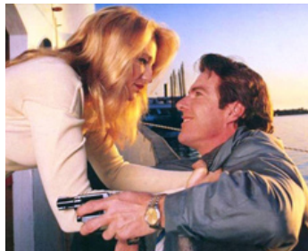
1987 BIG EASY, LE FLIC DE MON CŒUR (The Bit Easy) de Jim McBride avec Ellen Barkin