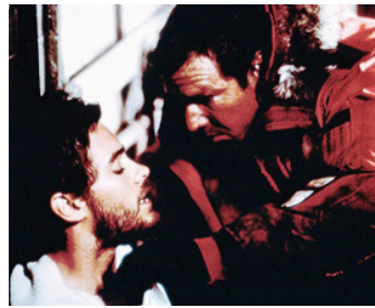
1997 LA PISTE DU TUEUR (Switchback) de Jeb Stuart avec Jared Leto