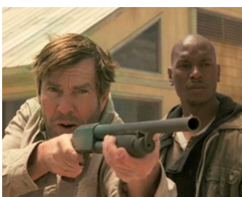
2010 LÉGION, L'ARMÉE DES ANGES (Legion) de Scott Stewart avec Tyrese Gibson