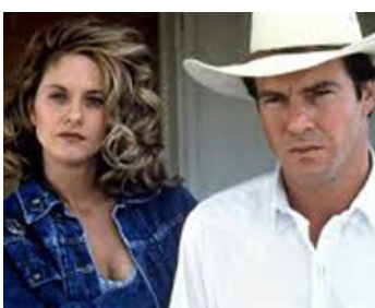
1993 FLESH AND BONE (Flesh and Bone) de Steven Kloves avec Meg Ryan