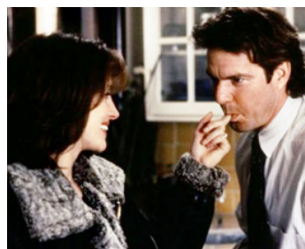
1995 AMOUR ET MENSONGES (Something to talk about) de Lasse Hallström avec Julia Roberts