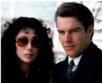
1987 SUSPECT DANGEREUX (Suspect) de Peter Yates avec Cher