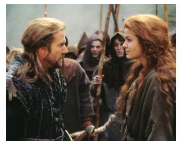
1996 CŒUR DE DRAGON (Dragonheart) de Rob Cohen avec Dina Meyer