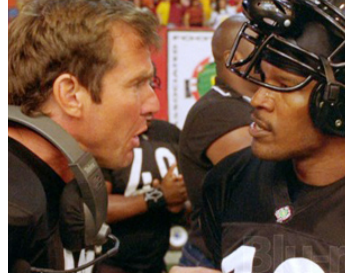
1999 L'ENFER DU DIMANCHE (Any Given Sunday) d'Oliver Stone avec Jamie Foxx