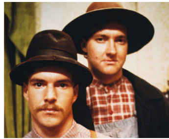
1980 LE GANG DES FRÈRES JAMES (The Long Riders) de Walter Hill avec Randy Quaid