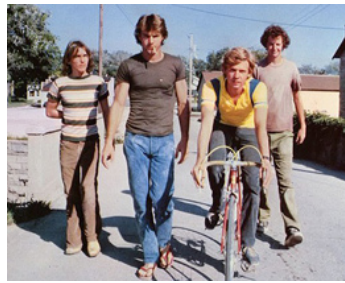
1979 LA BANDE DES QUATRE (Breaking Away) de P.Yates avec , D. Stoller, D. Christopher, D. Stern