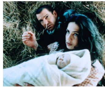
1998 SAVIOR (Savior) de Predrag Antonijevic avec Nastassja Kinski