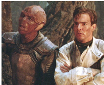
1985 ENEMY (Enemy Mine) de Wolfgang Petersen avec Louis Gossett Jr