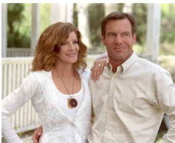
2005 UNE FAMILLE DEUX EN UN (Yours, Mine and Ours) de Raja Gosnell avec Rene Russo