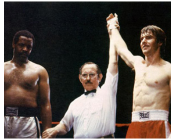
1983 LA FORCE DE VAINCRE (Tough Enough) de Richard Fleischer avec