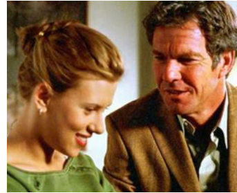
2004 EN BONNE COMPAGNIE (In Good Company) de Paul Weitz avec Scarlett Johansson