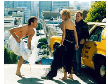
1987 L'AVENTURE INTÉRIEURE (Innerspace) de Joe Dante avec Meg Ryan