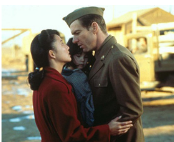
1990 BIENVENUE AU PARADIS (Come see the Paradise) d'Alan Parker avec Tamlyn Tomita