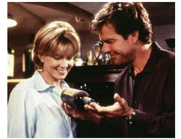
1998 À NOUS QUATRE (The Parent Trap) de Nancy Meyers avec Natasha Richardson