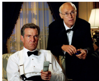
2006 AMERICAN DREAMZ (American Dreamz) de Paul Weitz avec Willem Dafoe