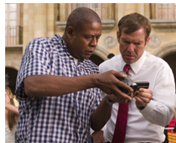
2008 ANGLES D'ATTAQUE (Vantage Point) de Pete Travis avec Forest Whitaker