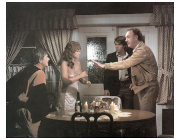
1981 LA VIE EN MAUVE (All Night Long) de J-Ci.Tramont avec Diane Ladd, Gene Hackman