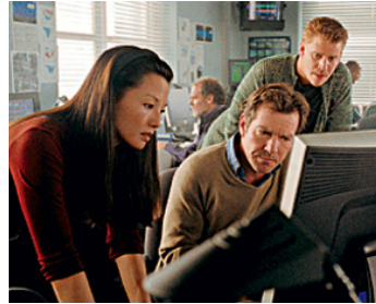
2004 LE JOUR D'APRÈS (The Day after tomorrow) de R. Emmerich avec Tamlyn Tomita, Dash Mihok