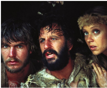
1981 L'HOMME DES CAVERNES (Caveman) de Carl Gottlieb avec Ringo Starr, Shelley Long