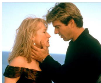
1990 BONS BAISERS D'HOLLYWOOD (Postcards from the Edge) de M. Nichols avec Meryl Streep