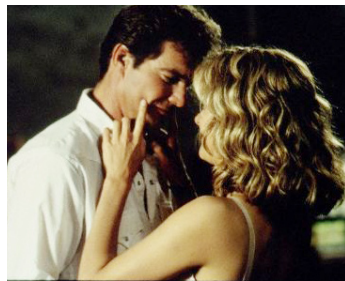
1988 MORT À L'ARRIVÉE (D.O.A.) d'Annabel Jankel & Rocky Morton avec Meg Ryan