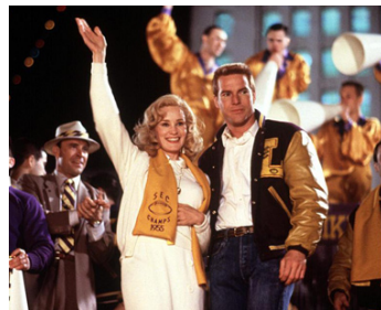
1988 EVERYBODY 'ALL AMERICAN de Taylor Hackford avec Jessica Lange