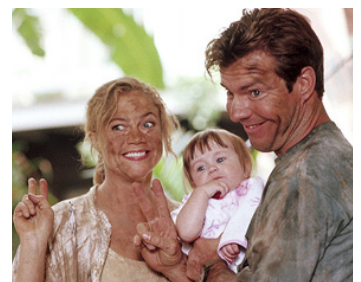
1993 PAS DE VACANCES POUR LES BLUES (Undercover Blues) d'H. Ross avec Kathleen Turner