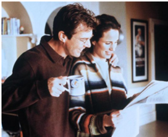
2001 DÎNER ENTRE AMIS (Dinner with Friends) de Norman Jewison avec Andie MacDowell