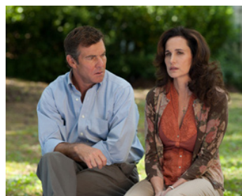
2011 FOOTLOOSE (Footloose) de Craig Brewer avec Andie MacDowell