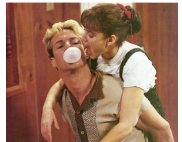
1989 GREAT BALLS OF FIRE (Great Balls of Fire !) de Jim McBride avec Winona Ryder