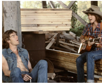
1981 THE NIGHT THE LIGHTS WENT OUT... de Ronald Maxwell avec Kristie McNichol