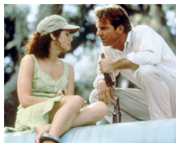
1993 MISE À FEU (Wilder Napalm) de Glenn Gordon Caron avec Debra Winger