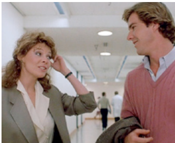
1984 DREAMSCAPE (Dreamscape) de Joseph Ruben avec Kate Capshaw