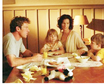
2002 RÊVE DE CHAMPION (The Rookie) de John Lee Hancock avec Rachel Griffiths, Angus Jones